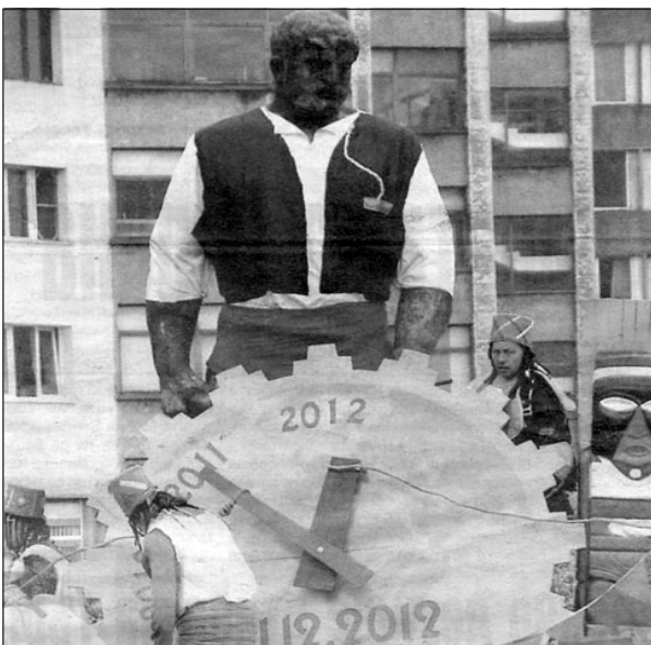
Габровци вързаха стрелките на часовника до статуята на Рачо Ковача... Отложиха края на света.

Държавата облага с такса за пускане в експлоатация и на частни пътища. Тук тарифата е от 150 до 3000 лв. на километър. От МРРБ обясниха, че сумата ще се дължи, независимо дали пътят може да се ползва от всеки, или е само за определени лица. Досега подобен текст в Тарифа № 14 липсваше и частните шосета „минаваха метър“. Горските и селскостопанските пътища, както и мостовите също вече влизат в обхвата на новата тарифа, като за тях ще се плаща между 150 и 3000 лв. за обект.